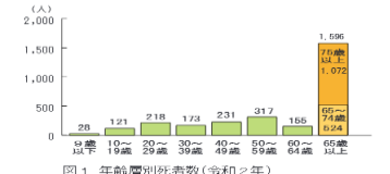
図1 年齢別死亡死者数(令和2年)

年齢層別に死者数をみると、65歳以上の高齢者が1,596人で(図1)、全死者数に占める割合は56.2%と過半数を占めています。また、65歳以上の高齢者の死者数を状態別にみると、歩行中が743人(46.6%)、自動車乗車中が457人(28.6%)、自転車乗用中が294人(18.4%)、二輪車乗車中が93人(5.9%)で(図2)、歩行中と自転車乗用中を合わせると6割を超えており、この傾向は前年とあまり変わっていません。高齢歩行者や高齢者の乗った自転車を見かけたときは、スピードを落とす、その動向に十分注意しましょう。