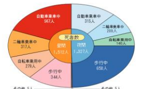
図6 昼夜別の状態別別死者数(令和2年)

死者数を昼夜別にみると、昼間が1,512人(53.3%)、夜間は1,327人(46.7%)で、前年(昼間50.5%・夜間49.5%)に比べると、昼間の比率が高くなっています。昼夜別・状態別にみると、昼間は自動車乗車中が567人(20.0%)で最も多いのに対して、夜間は歩行中が658人(23.2%)で最も多く、全死者数のほぼ4分の1近くを占めています(図6)。夜間走行時は、対向車と行き違ふときや他車の直後、交通量の多い市街地の道路を走行するときを除いて、こまめにヘッドライトを切り替え、できるだけ上向きにして歩行者を早めに発見するよう努めましょう。